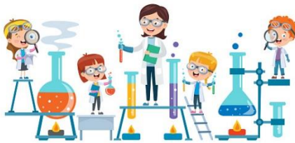
Scienze - Chimica